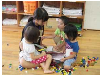
写真は、昨年の様子です!!