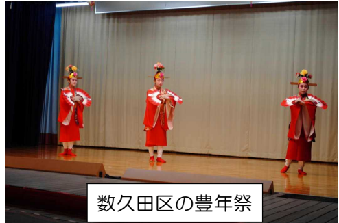
数久田区の豊年祭

古くからの伝統行事として引き継がれている各区の豊年祭が、11日(日)・12日(月)の数久田区を皮切りに、東江区で13日(火)・15日(木)・16日(金)、喜瀬区で13日(火)、城区で10月9日(日)・10日(月)に行われます。 各地の芸能やしまくとぅばを絶やすことなく、後生まで引き継いでほしいものです。