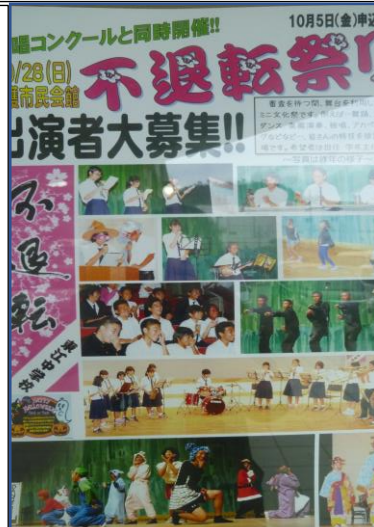
不転祭り出演者募集ポスター