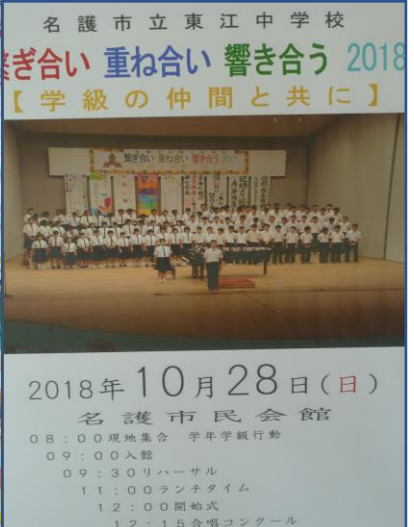
10/28 合唱コンクールポスター