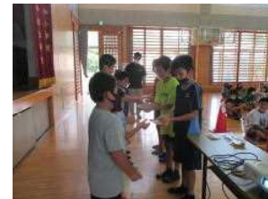
7問正解の愛生さんチーム