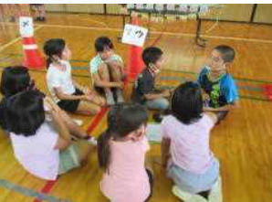
タイムアップ 回答は...