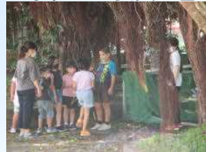
ガジマルの木の下で