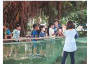
続々と質問に答える