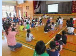
全体でルール説明