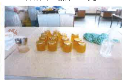
できあがったシークワサージュレ