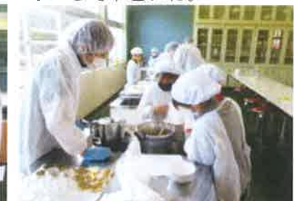
講師に教えて頂きジュレ作り