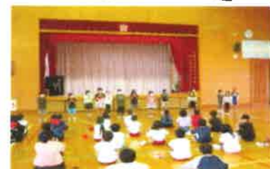
全員で音読した2年生

どの学年も声の大きさや表現の仕方などしっかり聴き、上手に感想を述べていました。「聴く力」育っていると感じました。