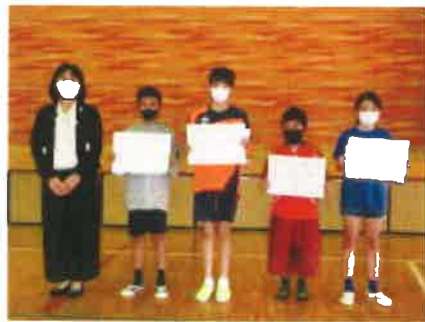
天賞・優良賞の皆さん