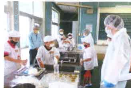
テキパキ準備をする4年生

各グループで作ったジュレは、安和小ラベルをつけて全幼児児童にプレゼントする予定です。楽しみにして下さいね。