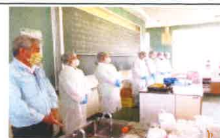
安村社長と講師のみなさん