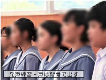
発声練習・声は背骨で出す