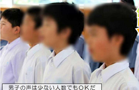
男子の声は少ない人数でもOKだ