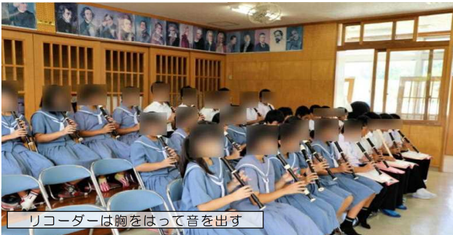
リコーダーは胸をはって音を出す

授業は、曲から受ける感じや感想を発表し合い、共有しました。絵がうまくなりたければ、いい絵をたくさん鑑賞することだが、音楽の場合も、たくさんいい音楽に出会うことだと思います。次回の課題は、打楽器を主に使ってオリジナル楽曲を創作することです。効果を予想して創った楽曲は演奏会で披露されます。楽しみです。楽しんでね。