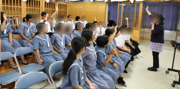
映画『ジョーズ』を観たことのある生徒は少ない