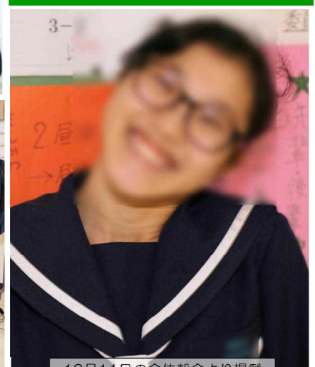
12月11日の全体朝会より掲載

「人権って何。」これは、友達に問いかけられた言葉です。私には、その質問に答えることが出来ませんでした。私は家に帰って、早速調べてみると、「人間が人として本来持っている権利」と書かれていました。私は、その答えに納得がいかず、先生にも聞いてみました。すると、先生は、「人権とは、人が人間らしく生きる権利のことだよ。」との返事が返ってきました。私は、「本来持っている権利って何。」と人間らしく生きるってどういうこと。」と、この疑問が脳裏から離れませんでした。そこで、「本来持っている権利」についても考えてみました。「生まれたときから生きている権利はあると思うので、本来持っている権利とは、『生きる』