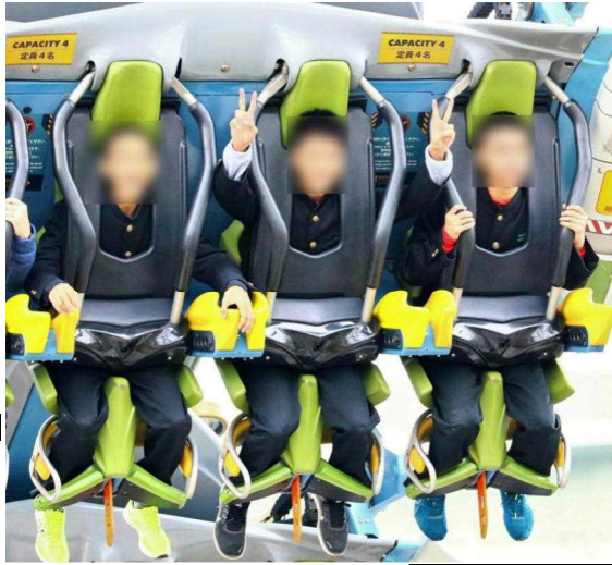
ジュラシック・パークの名物・ザ・フライング・ダイナソーに乗る。