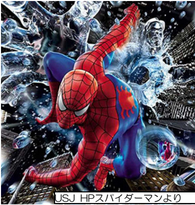
USJ HPスパイダーマンより