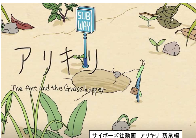
サイボウズ社動画 アリキリ 残業編