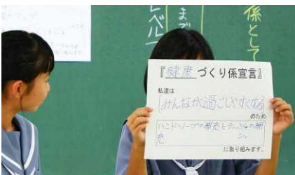
ハンドソープとティッシュを補充する健康づくり係