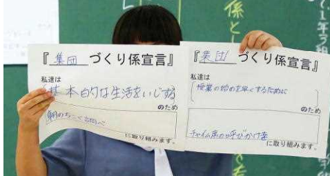
朝の登校調べとチャイム席を呼びかける集団づくり係

ベルアップ宣言が発表されました。全体進行では、役割分担と入念なシナリオが準備されコンパクトでスピーディーな展開に、日頃の学級活動の充実さとリーダー達の自覚が見られました。また、各係では、話し合いを進める人や記録する人がしっかりと責任を果たしており、活発な話し合いができていたと思います。1年3組さんの個人の成長や集団としての自覚と意識の高まりが確実に見られる学級活動だったと思えます。 今回の話し合いで決まった宣言を実行に移し、みんなによりよい羽地中学校を実現できるよう、期待します。みなさん、お疲れ様でした。よい学級活動でした。