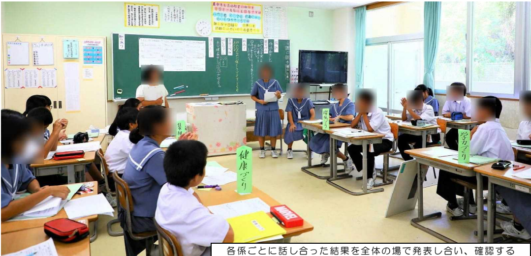
各係ごとに話し合った結果を全体の場で発表し合い、確認する