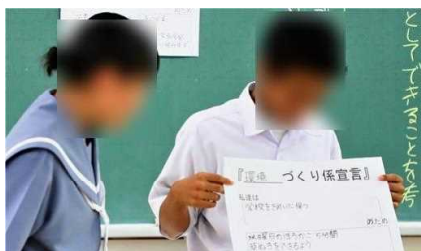
水曜日に5分間の草抜きをする環境づくり係

1年3組さんは12日(木)、学級のみんなのために、係としてできることを考え、話し合い、伝え合う活動を展開しました。 議題は「係活動をレベルアップしよう」です。学級役員から議題や提案理由、話し合いの手順が説明され、5つの係ごとに「これまでの係活動の現状とこれからのレベルアップした活動」について話し合われました。その後、話し合ったことを全体の場で発表し合い、係からし