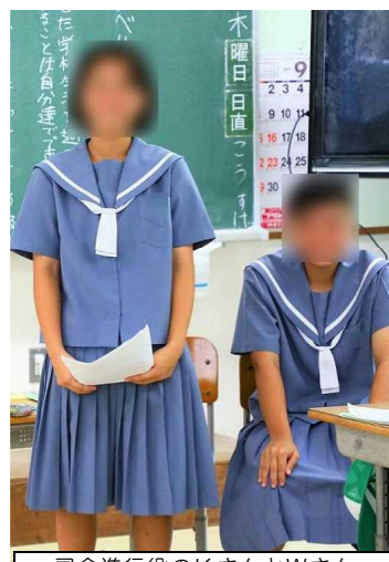
司会進行役のKさんとWさん

1年3組さんは12日(木)、学級のみんなのために、係としてできることを考え、話し合い、伝え合う活動を展開しました。 議題は「係活動をレベルアップしよう」です。学級役員から議題や提案理由、話し合いの手順が説明され、5つの係ごとに「これまでの係活動の現状とこれからのレベルアップした活動」について話し合われました。その後、話し合ったことを全体の場で発表し合い、係からし