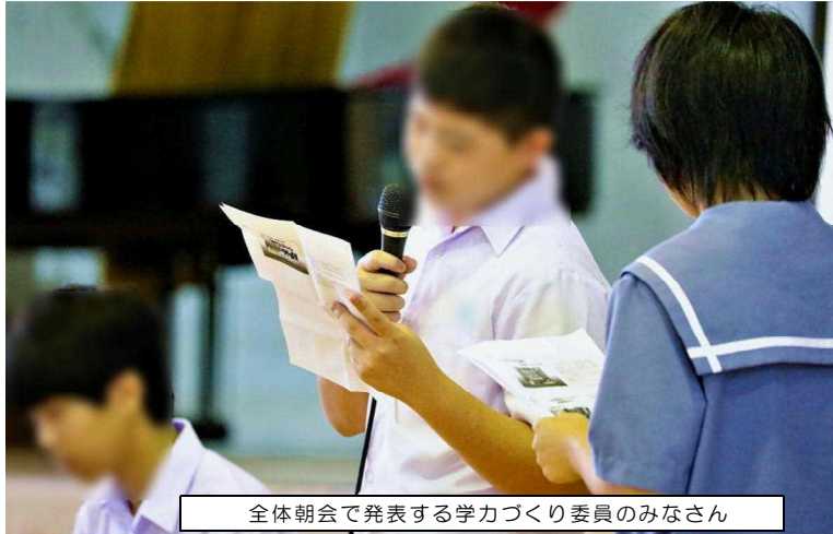
全体朝会で発表する学力づくり委員のみなさん

10月の生活目標は「読書活動を充実させよう」でした。この一ヶ月間、私たちは次のような活動をしました。 まず、10月初旬の全体朝会では、図書館の使い方を寸劇でアピールしました。いくつかハブニングもありましたが、無事に伝えることができました。 次に、学級対抗で「読書でバズル対決」を開催しました。①3冊読破、②ポップコ