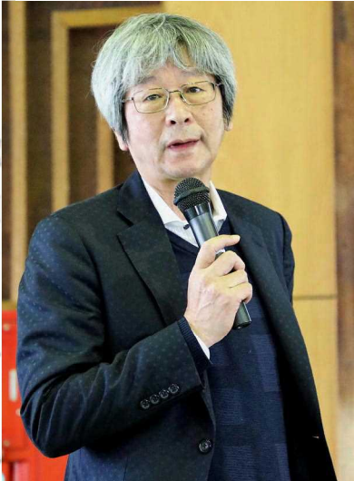
必ず笑いと話し合いを仕掛ける省三先生