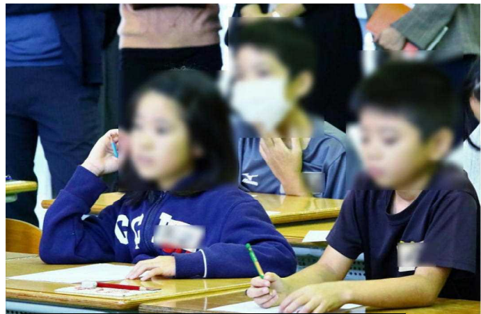
目や手の動きでしっかり考えているかが分かる4年生