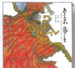
おきなわ島のこえ