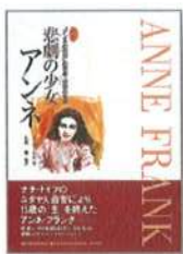
悲劇の少女アンネ