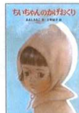
ちいちゃんのかげおくり