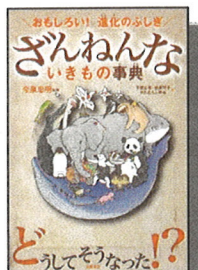
480 ㊦ 『ざんねんないきもの事典』