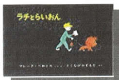
E マ 『ラチとらいおん』

生きるための「背骨」を身につける。勉強、 人生、人間関係、すべてが学べる教育書。