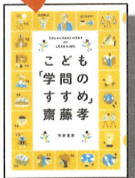
370 ㊦ 『こども「学問のすすめ」』