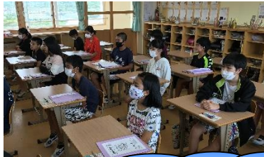
羽地小スタンダード

二期もスタートして約三週間になりました。暑い中頑張っている羽地っ子の様子を紹介します。