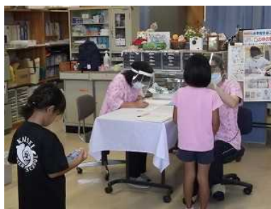
虫菌がないように・・・。

例年だと5月か6月に行う検診ですが、今回はこの時期までずれて実施しています。歯科検診では、校医の先生は、一人終えるたびに手袋を取り替えてから診察を行っていました。