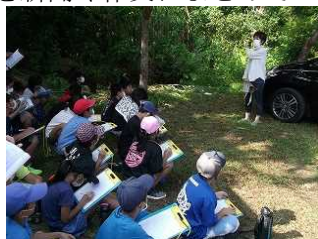
陶工からの説明を聞く

4・5年生の総合学習で古我知焼きの見学がありました。古我知焼きの歴史を聴いた後、作品と作業場を見学しました。魅力ある地域の古我知焼きを町自慢のひとつにしたいものです。焼き物づくりの体験もいつかできたらと思いました。後日、古我知焼きの魅力を新聞や作文にまとめていました。