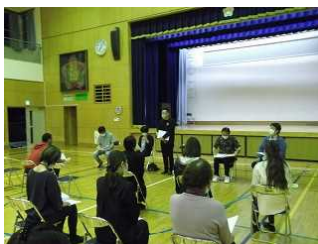
運営委員会の様子 体育館で行いました

今年度は、新型コロナウイルス感染拡大防止のため、PTA行事等の中止や縮小等があり、思うような活動ができず不完全燃焼だったと思います。次年度も終息してないので、制限はあるともいますが、しっかりと感染予防策を取り、「何ができるか」、「どうしたらできるか」を考え、協力して取り組んでいけたらと思います。話し合い事項は、PTA送別会の中止、卒業式の規模縮小、今年度のPTA活動経過報告、会計決算、学校車決算、令和3年度役員、部長(案)等について話し合われました。