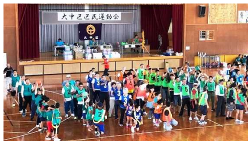
↑大中区 【ボール送り競争】