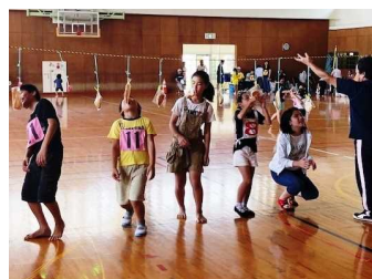
←大南区 【パン食い競争】

参加者が年々減少しているとのこと。子ども達一人一人が地域の担い手。子ども達が参加することで地域が元気に。 地域行事にも積極的に参加する子どもを育てたい。