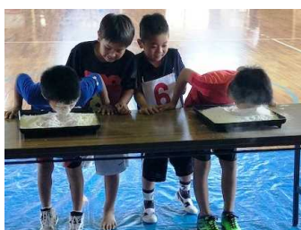
大西区→ 【あめ玉探し】