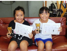
8/4 ソロ・デュコンテスト