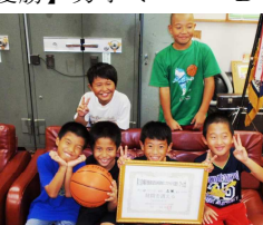
9/1 地区ミニバス大会