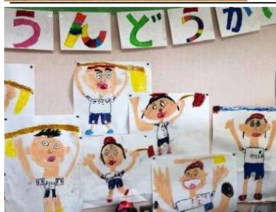
↑がんばった自分を絵にしました↓

○幼稚園生の感想 ○旗のダンスが面白かった。 ○ゆり組とばら組と一緒に丸くなるのが楽しかった。 ○お母さん、おばあちゃん、親戚の人に上手と言われた。 ○全部上手と言われた。 ○二年生のポンポンが上手だった。 ○一年生が幼稚園生ができて、先生からプレゼントをもらってうれしかった。