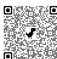
(2月23日希望者用 QR コード) (中学生対象)