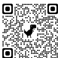
(2/18 日希望者用 QR コード) (小学4, 5, 6年生対象)