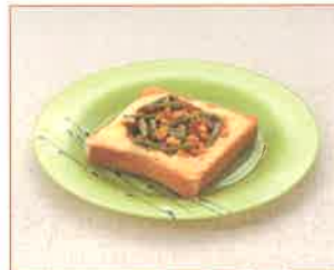
コーンといんげんのトーストサラダ