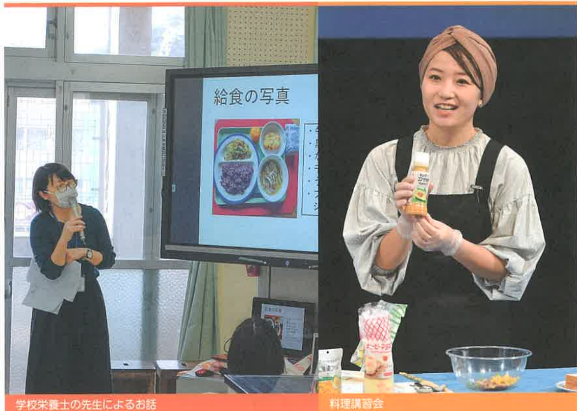
学校栄養士の先生によるお話