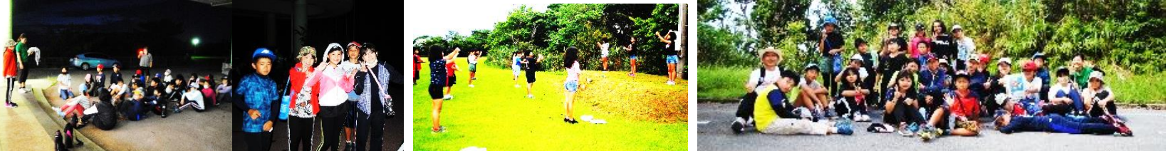
保護者・先生方の協力でのナイトオークラリー 朝の集い・ラジオ体操 夜と昼の森の散策を楽しんだ5年生！

13日：縄跳び朝会 1年～6年が、体育の時間や休み時間等で練習してきたいろいろな跳び方を披露しました。