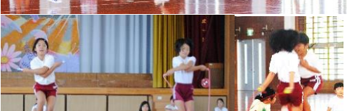
↑あやとび ↓大縄跳び ↑二人とび