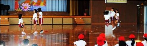
↑三人とび ↓片足とび

13日：縄跳び朝会 1年～6年が、体育の時間や休み時間等で練習してきたいろいろな跳び方を披露しました。