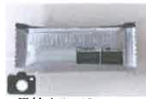
添付イメージ （製造番号、使用期限）